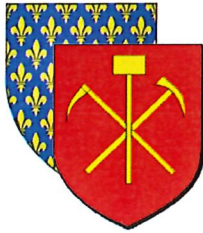
Ville de LOUCHES